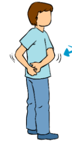
Estiramiento global en torsión por tramos (columna cervical)