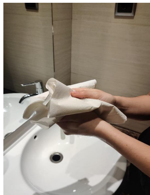
Eixuga't amb una tovallola d'un sol ús,