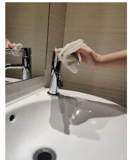
fes-ho servir per tancar l'aixeta i llença-la a les escombraries.