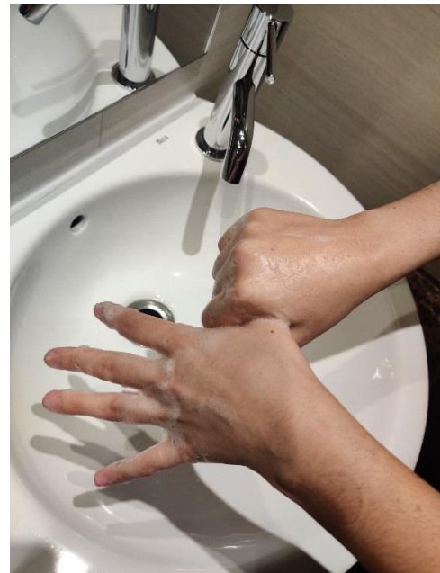
el polze amb el palmell de la mà, rotant,