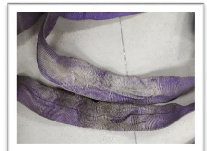
Abrasión y/o desgaste