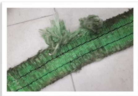
Cortes y/o rasgones