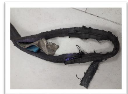
Rotura en gazas