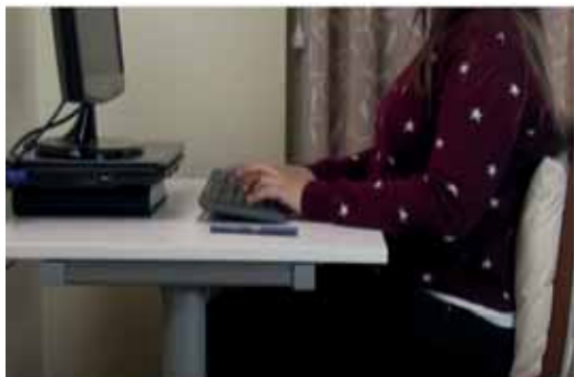
Guarda una distancia mínima desde el teclado al borde de la mesa.