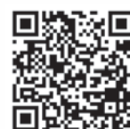
Campaña: “Si trabajas con pantallas, estira”.