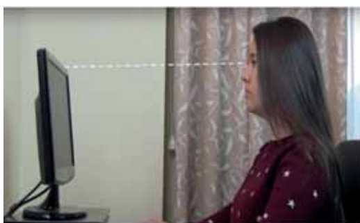
Coloca la pantalla frente a ti, a unos 40-50 cm aproximadamente.