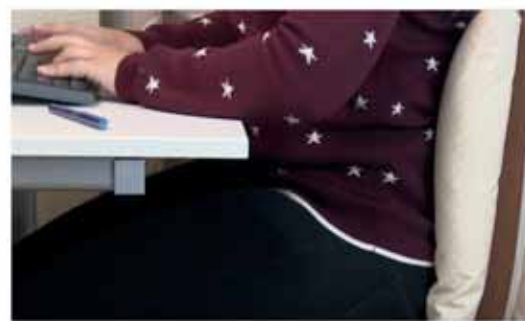
Mantén la espalda erguida y una adecuada sujeción lumbar. Ayúdate de un cojín en caso necesario.