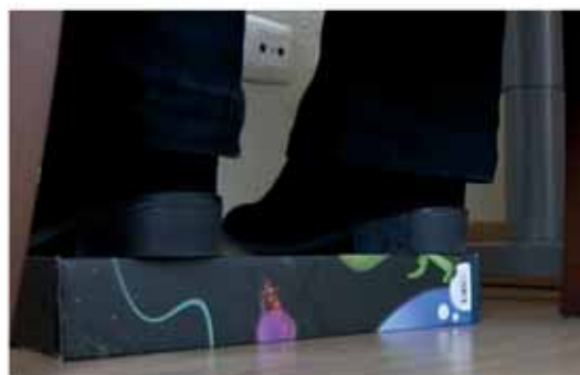
Usa un reposapiés en caso de no poder apoyar firmemente los pies en el suelo.