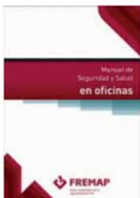
Manual de Seguridad y Salud en oficinas.

Para más información, en FREMAP tenemos a tu disposición el Manual de seguridad y salud en oficinas, una serie de vídeos denominada “Si trabajas con pantallas, estira” , para reducir la fatiga por el uso de pantallas de visualización, así como dos guías para efectuar estiramientos y reducir la fatiga por el uso de pantallas, así como una “Guía para el cuidado de la espalda” , que incluye enlaces a vídeos sobre potenciación, estiramiento e higiene postural durante tus actividades cotidianas .